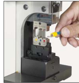
Kontakt einlegen, Sicherheitsüberwachung bleibt aktiviert