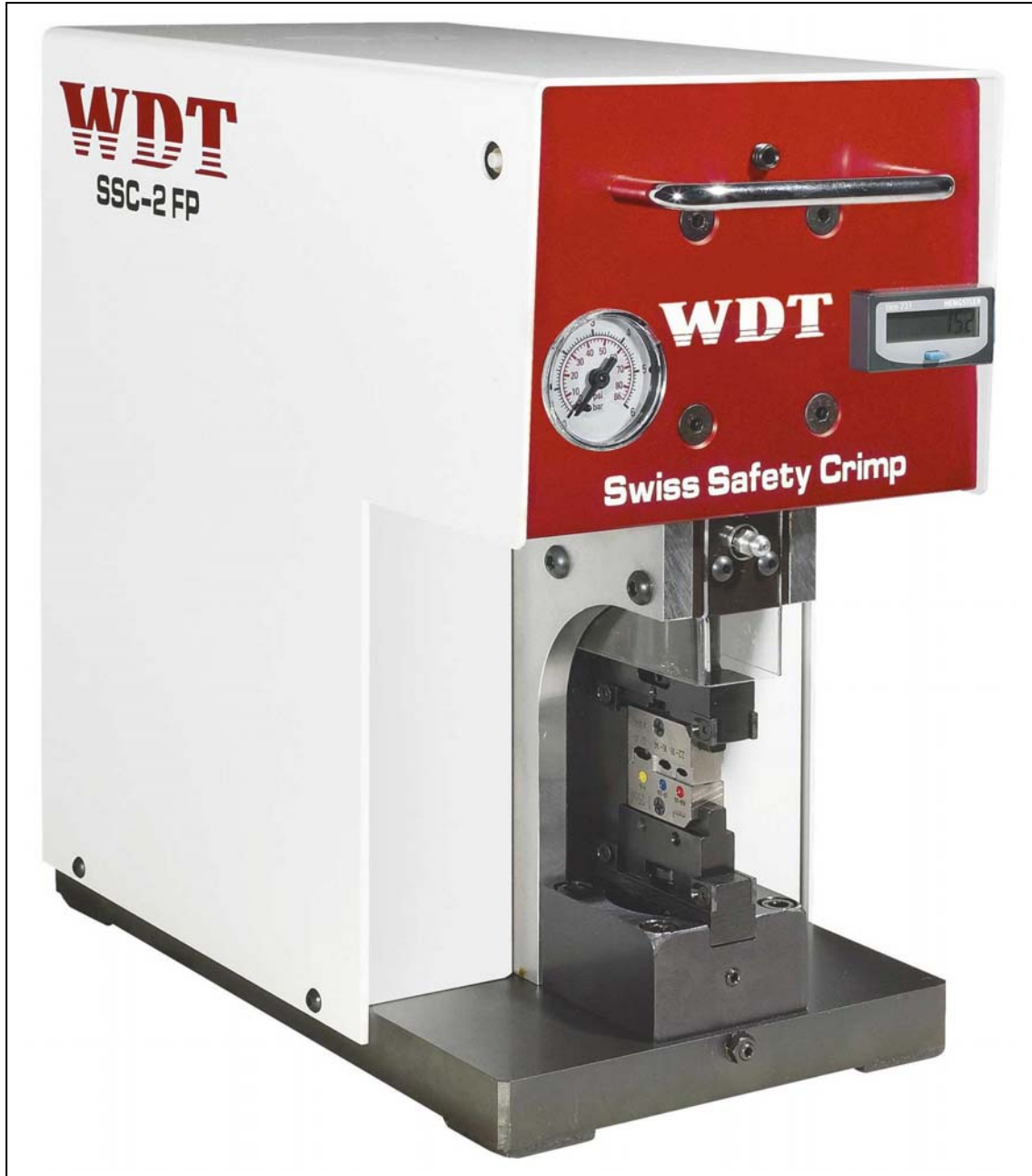
Swiss Safety Crimp von WDT