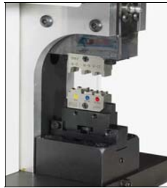
Presse offen, Sicherheitsüberwachung aktiviert